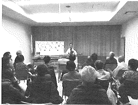
安佐北区身障協の平和大学の様子

なさんに作詞作曲実演職人として創作漫談を提供され、感動を与えられました。その内容は身障者仲間が聴き慣れた唄と一緒に歌ったり、楽しいお話を聞いて笑いこぼげたりしました。最後にはカープの応援歌を会場のみなさんと大きな声で歌い、笑顔になりました。寒い季節にもかかわらず、健康増進に繋がった日になったと思います。