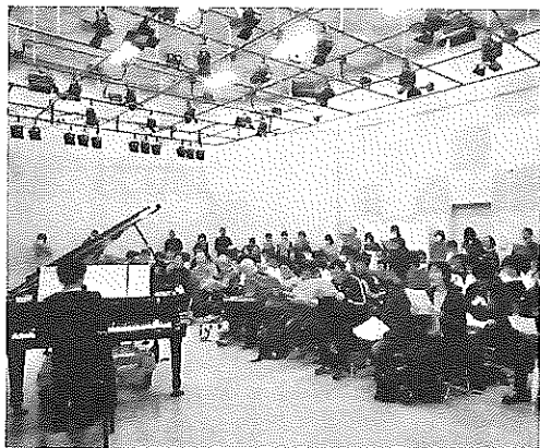
コーラスの練習風景

令和2月23日に広島国際会議場フェニックスホールにおいて「第15回マーガレットコンサート」が開催されました。今年度は新型コロナウイルス感染拡大の予防のため、スタッフ及び関係者はマスクを着用しての開催となりました。会場受付は、