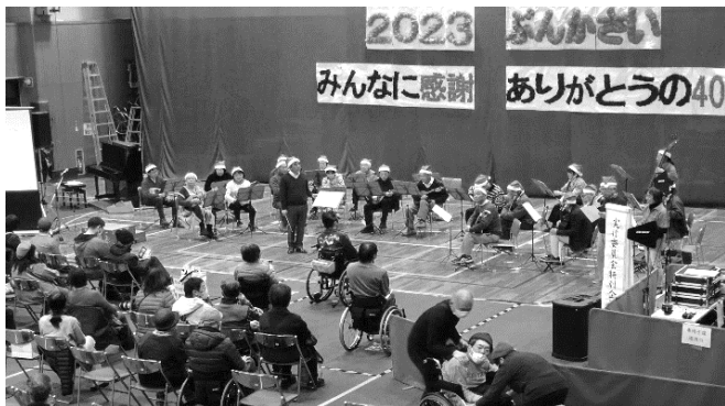
坂マンドリンクラブの演奏

特別公演は、坂マンドリンクラブの皆さんの美しく力強い演奏に盛んな拍手が送られていました。