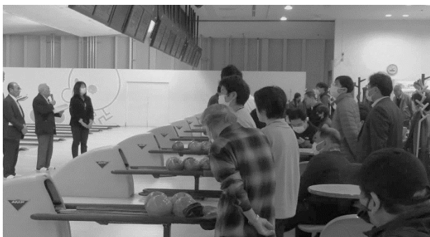
ふれあいボウリング開会式

広島市身体障害者福祉団体連合会、広島市手をつなぐ育成会、広島市心身障害児者父母の会、広島市精神保健福祉家族会など各団体のご協力、広島市障害福祉課 深崎課長様にご出席いただき、障害者の社会参加の促進と交流を目的に行われました。