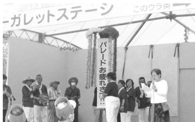
マーガレットステージ

ふれあい広場のマーガレットステージでは、初日はオープニングセレモニーの後、車いすダンス、歌、楽器演奏、マリンバ演奏などが行われました。2日目は歌謡ショー、和太鼓演奏、歌・演奏、白い杖のPR活動、神楽公演が行われました。3日目はフラダンスや和太鼓演奏などが披露され大いに盛り上がりました。