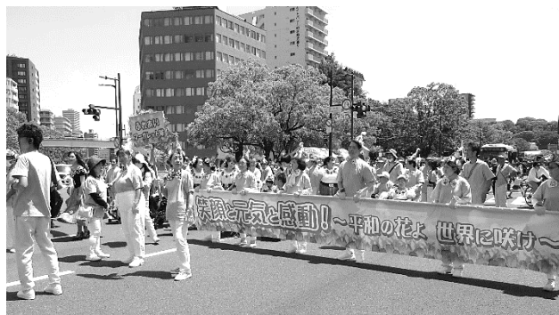
ふれあいマーガレット隊パレード

3日の花の総合パレードは晴天にも恵まれ、約130名は揃いの薄緑のTシャツを着て、今年のテーマ「笑顔と元気と感動～平和の花よ世界に咲け」の横断幕を先頭に、ふれあいマーガレット隊の「ブギウギ」の演奏で元気一杯に手を振りながら行進し、沿道からも大きな声援と拍手を浴びていました。