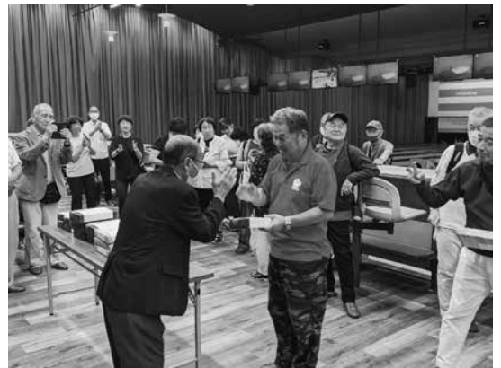
市身連ボウリング大会表彰式

5月30日(土)、第27回市身連身体障害者ボウリング大会を、佐伯区皆賀のミスズボウルにて開催しました。この大会は、9月18日(金)に福岡市で開催される「政令指定都市身体障害者福祉団体親善スポーツ大会」に出場する広島市の代表選手の選考会を兼ねていました。