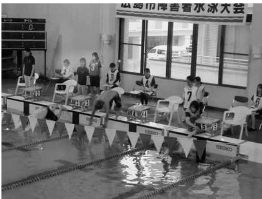
水泳競技スタートの様様

それぞれ2ゲームを投げ、順位を競いました。400点を超える大会新記録を出す選手が現れるなど白熱した戦いが繰り広げられました。 ◆ 広島市障害者卓球大会 3月1日(日)、第29回広島市障害者卓球大会が、広島市心身障害者福祉センター大体育室において開催されました。 身体21名、知的40名、精神11名の総勢72名が参加し、選手たちは障害の種類や年齢別のクラスに分かれ、日頃の練習の成果を発揮し、真剣に白球を追いかけ白熱した試合を展開しました。