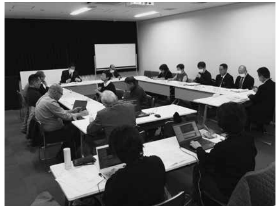
広島市障害者社会参加推進協議会

会議は、広島市の障害福祉部関係課及び市身連構成団体の4つの障害別団体と、日本オストミー協会広島県支部、広島市心身障害児者父母の会、広島市手をつなぐ育成会、広島