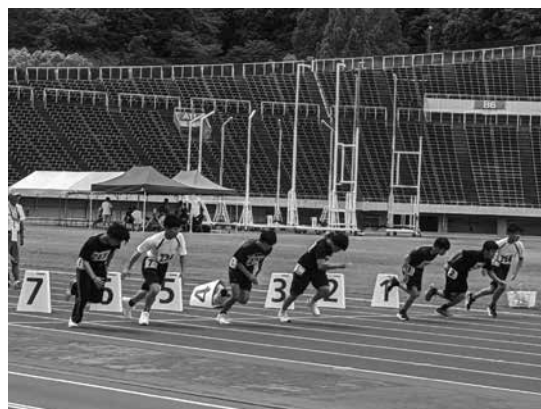
障害者陸上競技大会のトラック競技スタートの様子

この大会では25もの大会新記録が生まれるなど、選手の皆さんは日頃の練習の成果を十分に発揮されました。