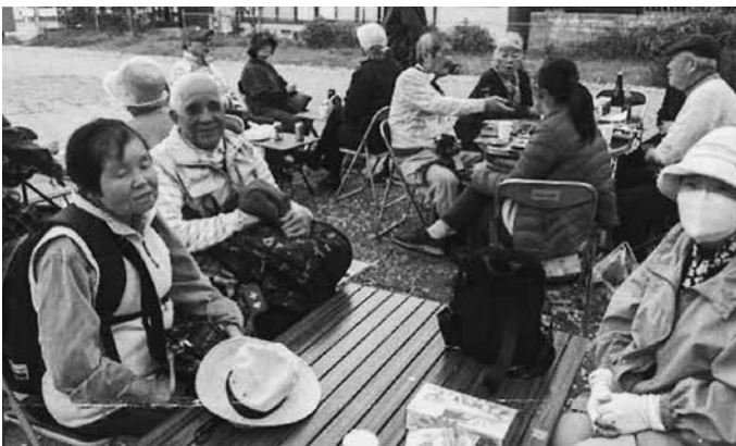
安佐南区身障協のお花見の様子