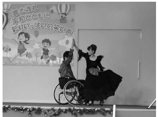
華麗な踊りを披露する車いすダンス

ふれあいの広場では、パレード隊から広場関係者への引継式が行われ、恒例のくす玉割りが行われました。