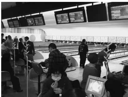
ふれあい交流会ボウリング大会の様子

ステージでは、車いすダンスをはじめ、フラダンス、和太鼓演奏など、歌や演奏が披露されました。広場では27の団体がカフェやゲーム、手作り作品販売などのブースを出店し、来場者への売り込みに汗を流しました。