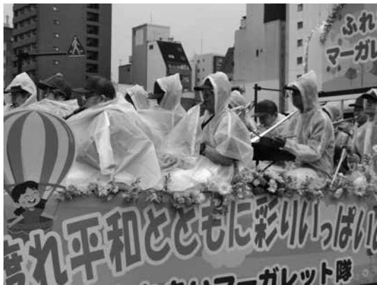
装飾を施したトラックの上で演奏する音楽隊

特に、外国人の観客の方は大きなジェスチャーで拍手・応援を送ってください、参加者に元気を与えてくれていました。