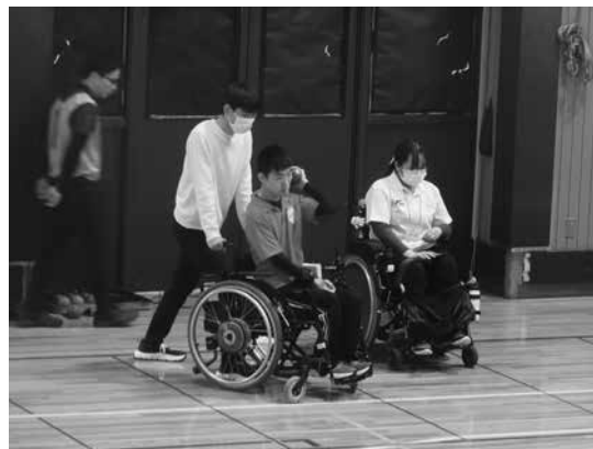
ポッチャ競技 (座位の部)

選手が投げて位置を決める的となるジャックボールの位置取りやその的を狙う技の数々など見ごたえのある試合が展開されました。