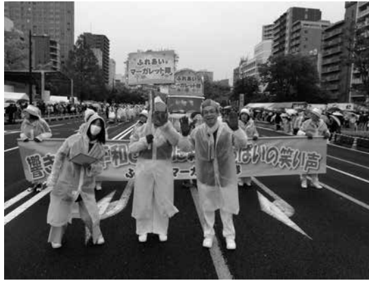
雨のなか元気に進行するふれあいマーガレット隊

広島と世界を結ぶ平和の花の祭典「2026ひろしまフラワーフェスティバル」が5月3日～5日に開催され、147万4000人の人出で賑わいました。